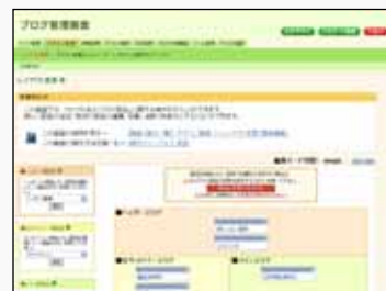
<簡単に更新できる管理画面>

その上、写真の掲載やメニューの変更、資料請求フォームの作成も自由自在。専門スキルがなくても、本格的な企業ホームページが運用できます。